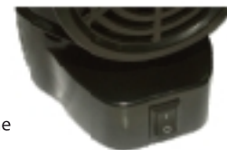
Power on/off button

4. If you decided to stop heating of a room, press the power on/off button again (position "O").