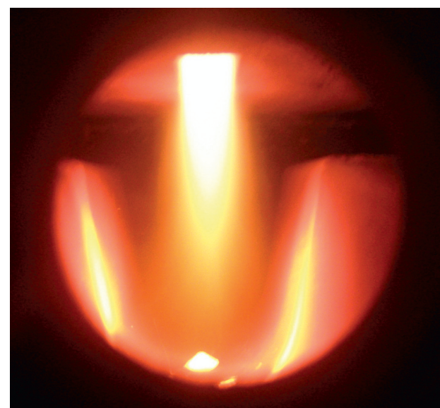
Пиролизный принцип сжигания обеспечивает высокий коэффициент полезного действия котла Vitoligno 100-S

Топка котла, изготовленная из стальных листов толщиной 8 мм, и надежный вытяжной вентилятор обеспечивают длительный срок службы котла Vitoligno 100-S.